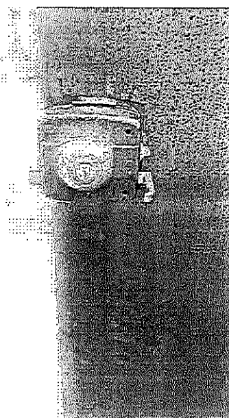
CHAPA DE SEGURIDAD