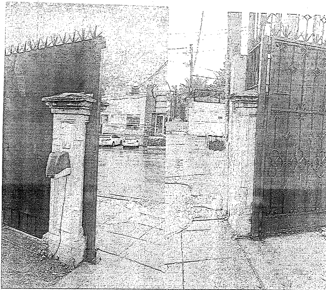
DOS POSTES DE ANCLAJE MEDIDAS 2.89 MTS.