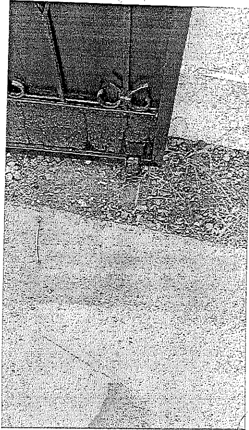
RUEDA DE USO RUDO